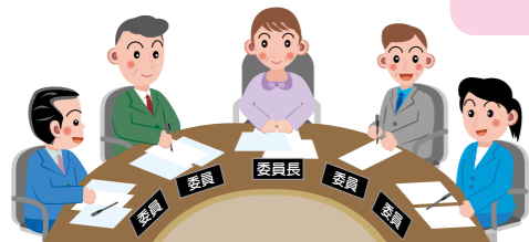
市民教育委員会など