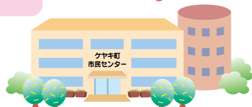
市民センターができる