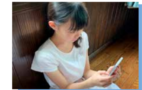
民間調査では中学生のLINE利用率は9割を超える