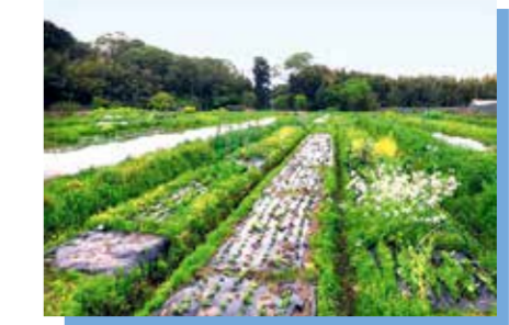
地産地消で食を確保し、農業で稼げる仕組みづくりが重要