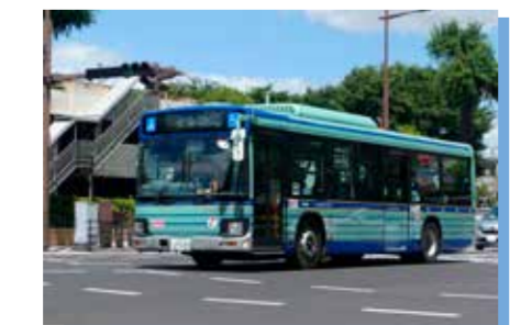
市バス等都市公共交通の活性化にはまちづくり施策との連動が不可欠