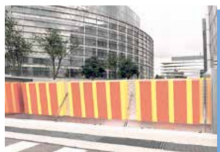
水の浮力を利用して自動起立する自動昇降式・フロート式止水板