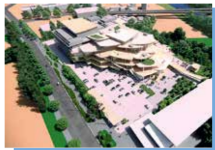
音楽ホール等複合施設は投資に見合う価値の創出を