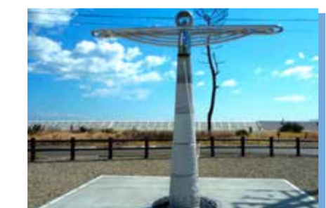
防災集団移転跡地に立つ鎮魂のモニュメント「荒浜記憶の鐘」