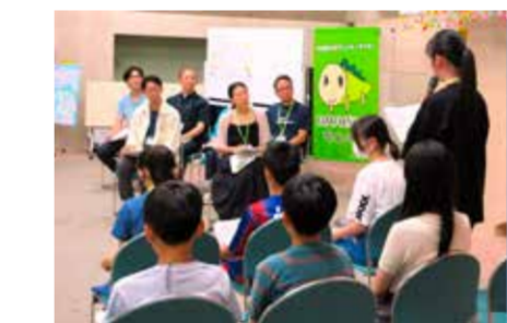
こどもの意見を市政に反映させる仕組みを