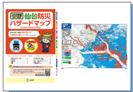
洪水浸水想定区域などを確認できる仙台防災ハザードマップ