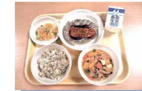
仙台産雪菜を使用し、全国学校給食甲子園で特別賞受賞の柊江小学校の給食