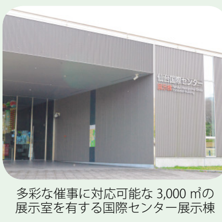
多彩な催事に対応可能な3,000㎡の展示室を有する国際センター展示棟

答 差別や誹謗中傷は、感染症に対する恐れや不確かな情報による不安感によることが多く、感染症を正しく理解してもらうことが肝要である。今後とも、市民に粘り強く呼びかけていきたい。