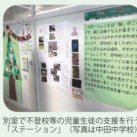
別室で不登校等の児童生徒の支援を行う「ステーション」(写真は中田中学校)

答 不登校の児童生徒やその保護者が一人一人に応じた支援を安心して受けられるよう、民間施設との連携をさらに推進するなど、教育委員会と共に対策の強化を図っていく。