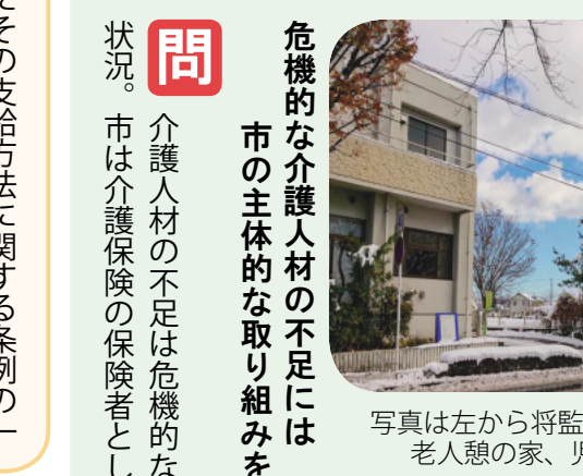
写真は左から将監市民センター、老人憩の家、児童センター

答 市民交流スペースについて運営に必要な体制づくりや資金確保等に向けた地域の方々の議論を