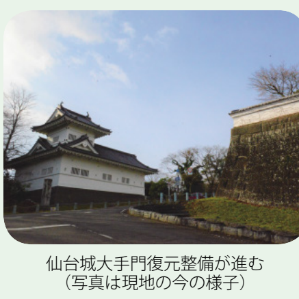
仙台北門復元整備が進む(写真は現地の今の様子)

○中心部震災メモリアル拠点の整備 ○音楽山公園と大手門復元整備 ○新型コロナウイルス感染症拡大防止策 ○介護事業所へ本市独自の支援策を ○仙台市DX推進計画とデジタル化 ○新仙台市基本計画等と都心再構築 ○森林環境譲与税に関する取り組み