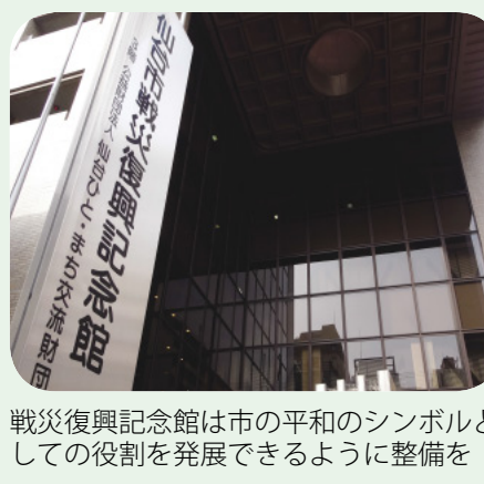
戦災復興記念館は市の平和のシンボルとしての役割を発展できるように整備を

答 戦災復興記念館は、音楽ホール整備後は更新を行わない方向での検討が望ましいと整理したが、展示室やホールが一体となって果たしてきた役割を継承できるように