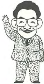
画・いがらしみきお