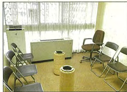
議員特権との声もあった喫煙室がようやく廃止

平成29年第3回、令和元年3月定例会等で、厳しく指摘してきた仙台市議会の議会棟の喫煙室が令和2年3月末で廃止されることになりました。昨年の11月の各派代表者会議で一度は存続が決まった喫煙室ですが、「時代に逆行した対応だ」等という世論からの批判もあり、廃止が決まりました。健康増進法改正の趣旨や、受動喫煙防止の観点からも廃止されるのは当然です。仙台市議会の喫煙室は、「市議会だけ特別扱いはダメ、議員特権だ」という声も市民からお寄せ頂いていました。これからも、おかしいことは、おかしいと市民の声を市政に届けていきたいと思ひます。