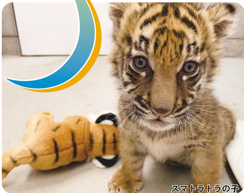
スマトラトラの子