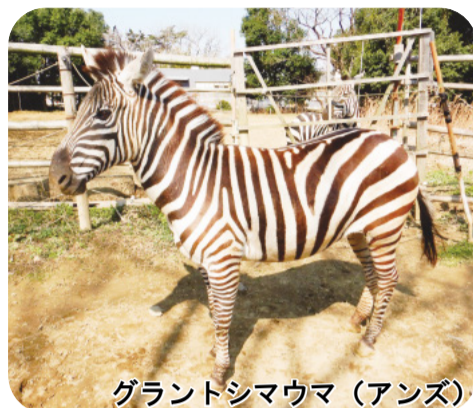
グラントシマウマ (アンズ)