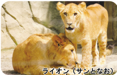
ライオン (サンとなお)