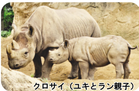
クロサイ (ユキとラン親子)