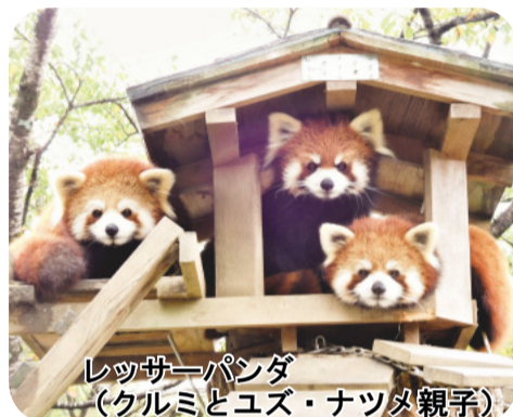
レッサーパンダ (クルミとユズ・ナツメ親子)