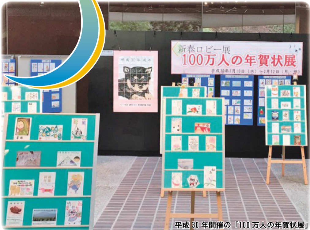
平成30年開催の「100万人の年賀状展」