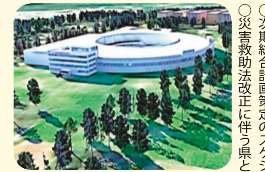
東北放射光施設イメージ図

○東北大の理系人材の流失防止と地元中小企業と東北大の産学連携支援の取り組み ○コールセンターでの苦情対応 ○改良型芝生の活用等により、仙台スタジアムの稼働率向上を ○市立小中高校へのエアコン設置 ○体験観光ニースの把握と体験プログラムの創出 ○外国人視点を取り入れたコンテンツ発信によるインバウンド推進