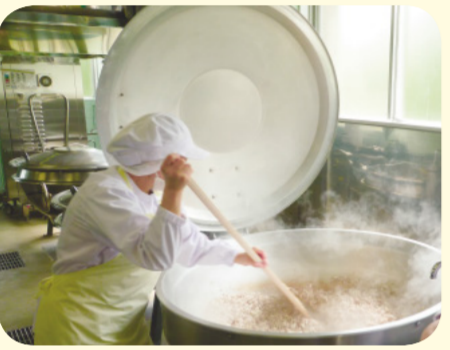
エアコンのない中での学校給食調理作業

普通教室、職員室や給食調理場へのエアコン設置について ○財政見直しと市税の滞納整理 ○2歳児預かり保育に携わる幼稚園職員への保育研修の必要性 ○児童扶養手当支給制度の改正に伴い想定される効果 ○ひとり親家庭の生活を支える養育費の周知啓発と国への要望 ○吉成保育所移転に伴う用地取得 ○自転車の安全利用に関する条例