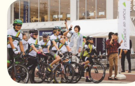
復興支援イベントとして行われている「ツール・ド・東北」