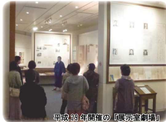
平成29年開催の「展示室劇場」