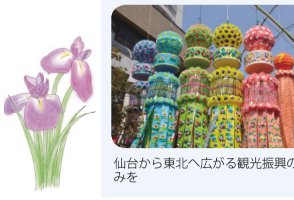
仙台から東北へ広がる観光振興の取り組みを

○職員が市長の指示だけで進むようでは、指示がない間は状況が停滞し、指示以上のスピードで変更することはない。 ○市長は多くの職員とミーティングを持ち、多くの現場に足を運んでいただきたい。 ○職員は機動性を持ち非生産的な仕事はやめ思い切って挑戦