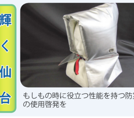
もしもの時に役立つ性能を持つ防災頭巾の使用啓発を

○職員が市長の指示だけで進むようでは、指示がない間は状況が停滞し、指示以上のスピードで変更することはない。 ○市長は多くの職員とミーティングを持ち、多くの現場に足を運んでいただきたい。 ○職員は機動性を持ち非生産的な仕事はやめ思い切って挑戦