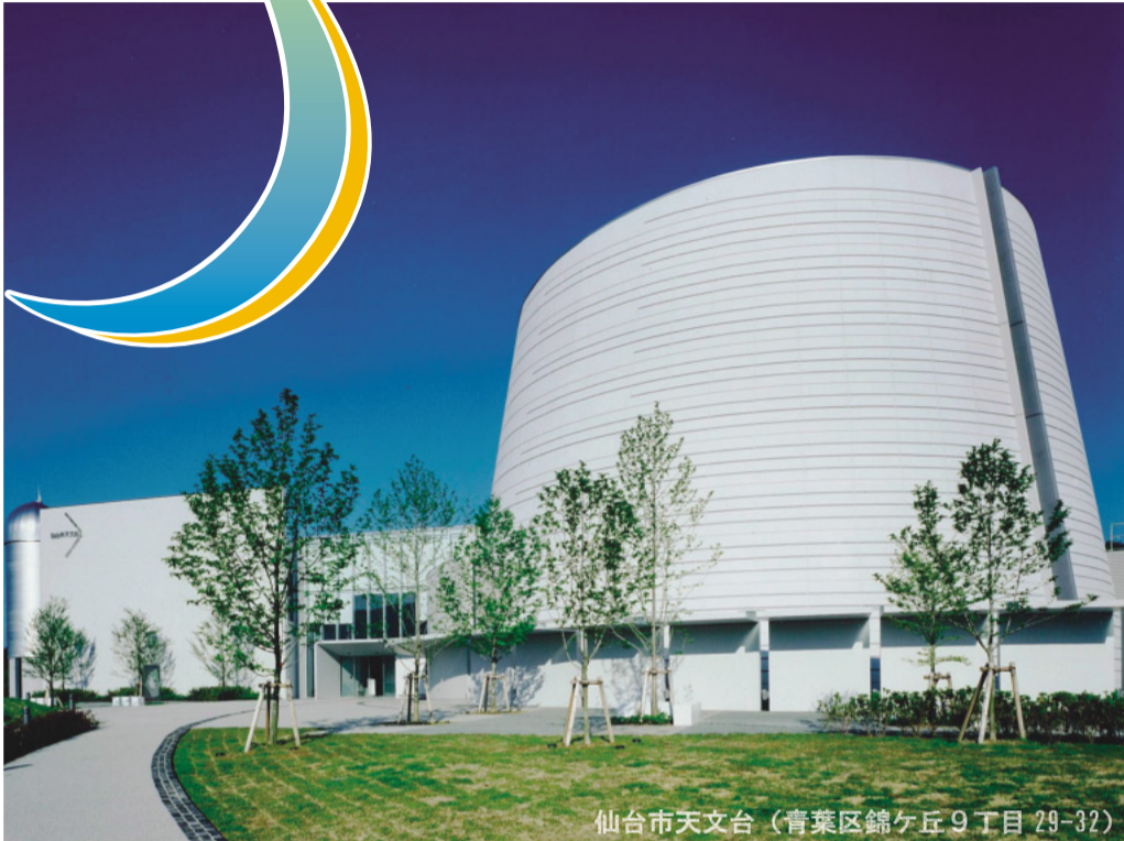
仙台市天文台（青葉区錦ヶ丘9丁目29-32）