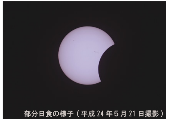
部分日食の様子（平成24年5月21日撮影）