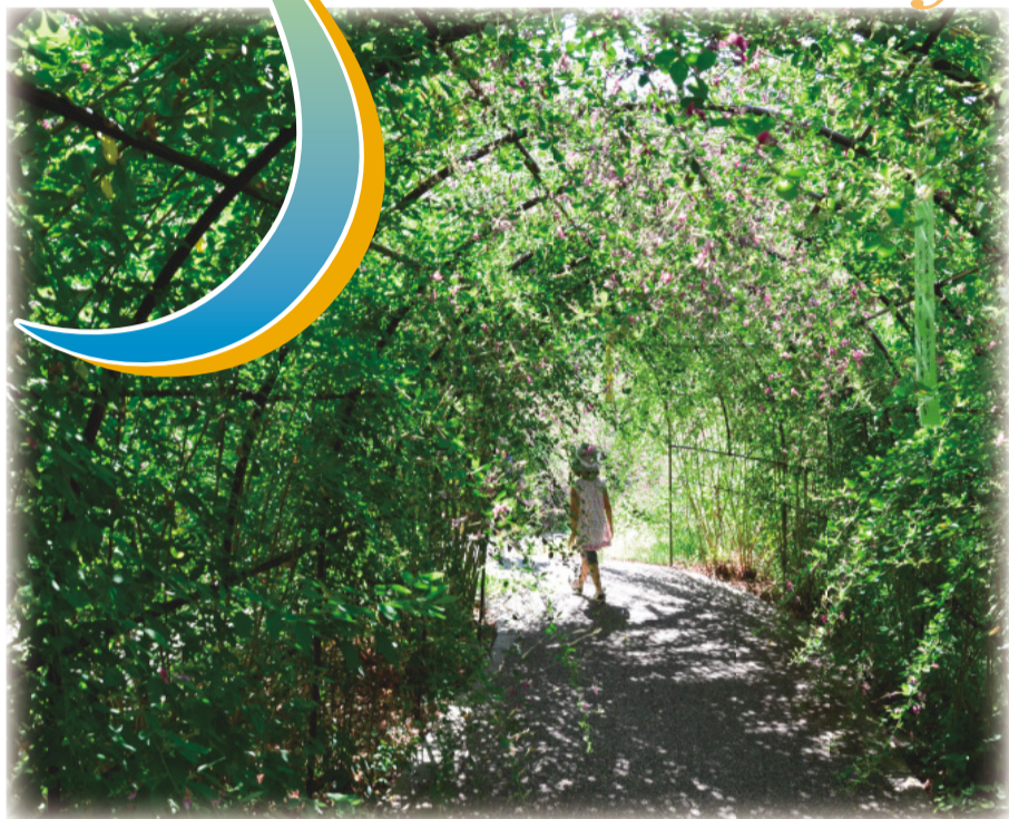
萩のトンネル(野草園)