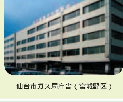
仙台市ガス局庁舎（宮城野区）