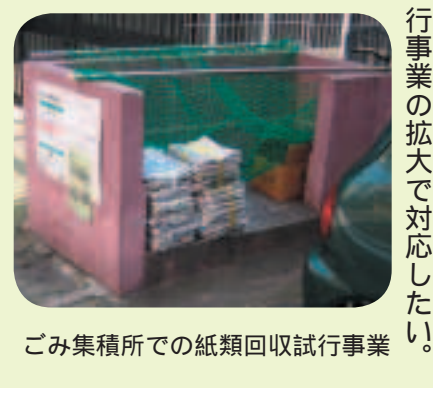
ごみ集積所での紙類回収試行事業