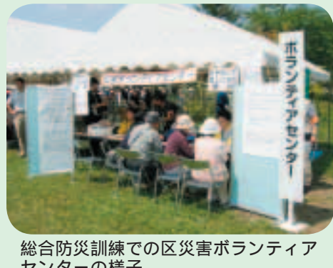
総合防災訓練での区災害ボランティアセンターの様子

答 政策目標の達成に全力を尽くしており、概ね着実に実現が図られていくものと認識している。今後も、目標の実現に邁進してまいりたい。その他の主な質問項目 少子化対策のうち、両立支援についての具体例 今後の保育所整備拡大 全国学力・学習状況調査と仙台市標準学力検査