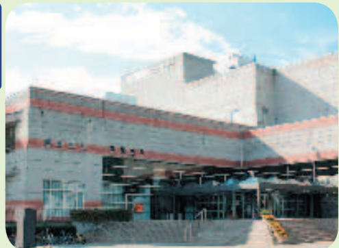
広瀬図書館(青葉区)

今定例会に提出された議案等17件のうち、16件が可決され、成立しました(8面の賛否一覧表をご参照ください)。以下、成立した議案の一部を紹介いたします。