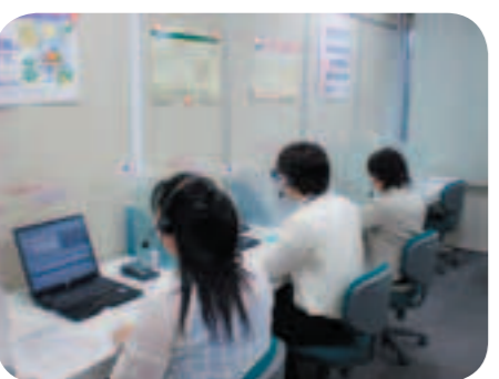
7月に開設した仙台市納税推進センター

答 税の収納率向上については、歳入確保の重要な課題として、現在様々な取り組みを進めている。