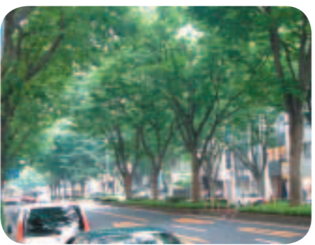
移植の是非が問われている青葉通のケヤキ

答 地下鉄東西線の着工や沿線の街づくりへの着手を始め、明日への都市づくりを進めると共に、