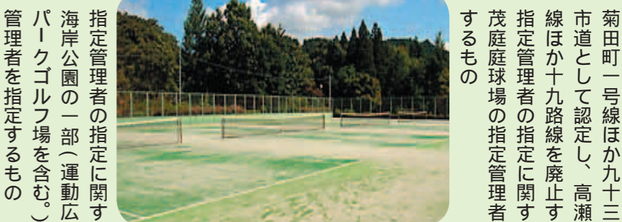
茂庭庭球場(太白区)

「非常勤消防団員等に係る損害補償の基準を定める政令」の改正に伴い、配偶者以外の子女等の扶養親族のうち三人目以降のものに係る補償基礎額の加算額を改定するもの 仙台市図書館条例の一部を改正する条例 指定管理者に図書館の管理を行わせることに必要な事項を定めるもの