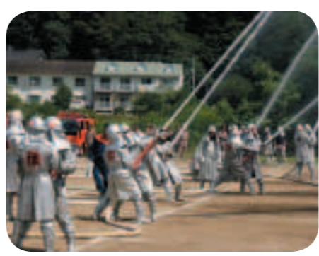
消防団の活動の様子

答 大規模災害を想定した消防団の訓練・研修等事前の取り組みを強化していく。本市職員が地域の中で、防災・減災対策に関わることは重要なことと認識しており、今後、市地域職員防災会議の更なる