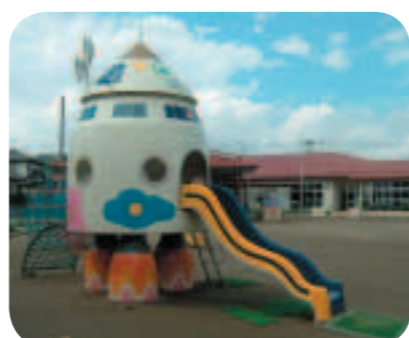
市民や利用者のニーズを的確に反映した保育施設整備や保育施設構築を

答 利用者との人的関係が重要な福祉施設等、公募に馴染まない施設がある一方、業務範囲を見直す等の工夫で新たに公募の可能性が出る施設もある。民間活力の積極的活用や官民の役割分担見直しという社会的要請を踏まえ、施設の特徴にも配慮しながら、公募拡大を基本に適切な対応に努める。その他の主な質疑項目