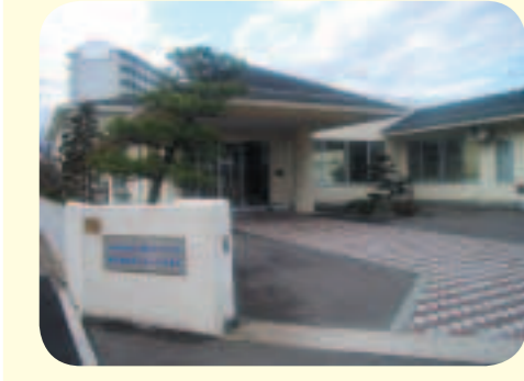
特別養護老人ホーム白東苑(太白区)

問 ガス事業の民営化を本格的に進めようとしているが、市民の利益を考慮するならば、なぜ民営化なのか、その必要性を市民に具体的に説明すべき。労使との協議も重要と思うが、見解を伺う。 答 平成十七年度から庁内での民営化に向けた諸課題を検討しており、一定の熟度まで作業が進んだ。今後、有識者による検討委員会の検討や議会での議論を頂きながら