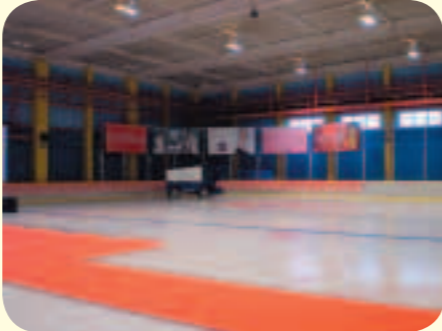
「アイスリンク仙台」として3月22日に再開されたスケートリンク

問 閉鎖されていた泉スケーティングが「アイスリンク仙台」として再開されるが、リンクの運営を維持するための市の支援策について伺う。また、リンクは平成二十五年までの契約だが、恒久的なリンクのあり方についての検討・調査を開始すべきだ。所見を伺う。 再開について スケートリンクの