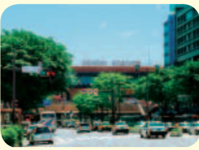
東北の発展を牽引する仙台市

問 都市ビジョン策定に当たっての課題認識と、どのように政策として展開していくのかを伺う。また、本市が東北の発展を牽引するためのビジョンの意義を伺う。 答 人口減少時代の到来など都市を取り巻く環境は劇的に変化しており、将来を見据えた都市づくりに戦略的に取り組む必要がある。その政策展開としては、今後四年