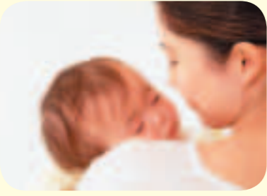
子育て・少子化を挙げた少子化・子育てを社会への取り組みを国や社会への取り組みを

新年度予算での重点施策である。その内容は、地域支援として、子育てふれあいプラザの二箇所増設や子育て支援室の十二箇所整備による支援拠点の確保等や、経済的支援として、乳幼児医療費助成については、通院対象年齢の拡大や所得制限緩和による対象児童の拡大等を図るものである。