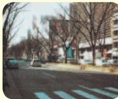
予算の凍結が求められる青葉通のケヤキ

問 ケヤキ移植のための予算は凍結し、再検討を 答 ヤキ移植に約一億六千万円の多額な費用がかかり、反対意見が多い。移植と伐採の経費を市民に知らせ、本市の財政状況等も考慮しながら検討すべきであつたはずだ。移植のための予算執行は凍結し、別の手法を含め再検討を求め、所見を伺う。 市民への情報提供が十分に