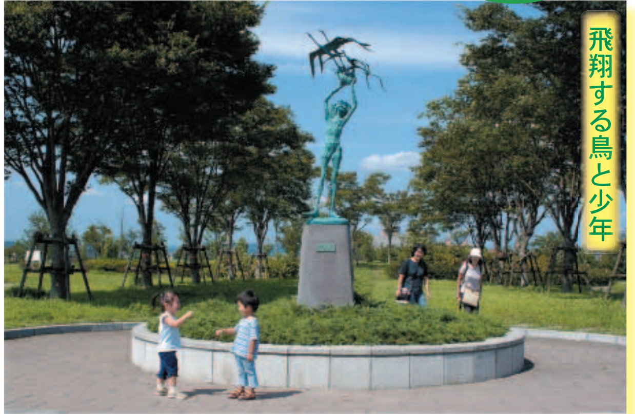
飛翔する鳥と少年