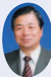
副議長 相沢 芳則