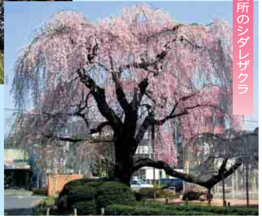
若林区役所のシダレザクラ