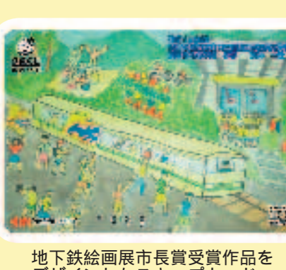
地下鉄絵画展示市長賞受賞作品をデザイン

問 ガス局港工場用地の一部売却の価額は、一社のみで鑑定に基づくものであり、問題があるのではないかと。 答 工場用地の処分にあたり、第三者機関である公有財産価格審議会の答申をいたして、手順に従い、予算を提案した。 水道局からの報告 水道料金等のコンビニ収納