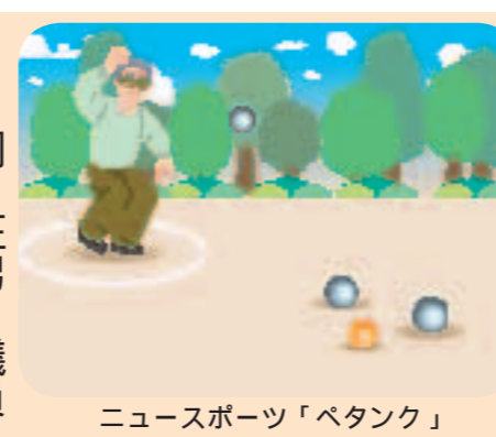
ニュースポーツ「ベタンク」

問 生涯にわたって楽しめるベタンク等のニュースポーツの振興策について伺う。 答 誰もが気軽にスポーツを楽しむようにするため重要と考え、市民レクリエーションまつりの開催等各種の支援を行っており、今後もベタンク等ニュースポーツの振興に努めていきたい。 問 ピンクチラシ根絶に向けて一層の取り組みをすべき。 答 新しいタイプのピンクチラシが出始めたので、この機を逃さずに、県警、関係団体、市民の力を結集して、さらに粘り強く取り組みたい。その他の主な質問項目 地方自治制度変革への対応 区役所改革への取り組み