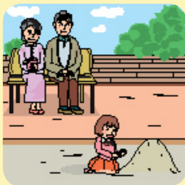
マンモグラフィを併用した乳がん検診の拡大

問 指定管理者の選定に当たり公平性を確保し市民の声を反映することができるとの。 答 専門性・公平性の確保のため外部委員を入れた選定委員会を選定基準を定める。 問 現事業者による児童館ネットワークでサービスを充