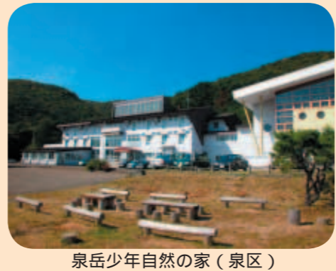
泉岳少年自然の家(泉区)

問 外郭団体は市の委託料や補助金により事業を行っているが、一層の効率化のため、事業運営体制を検証し、対策を講ずるべきではないか。 答 これまでも経営評価を実施してきたが、経営の効率化のため、適切に助言・指導を行うとともに、外郭団体のあり方についても個別に踏み込んだ検討を幅広く行う。その他の主な質問項目 泉岳少年自然の家を活用し、泉岳環境教育の実践を、泉岳野外活動センター等の有効な利用促進の対策を、自主防災組織の認識不足の解消と意識高揚の取り組み、避難場所の確保に向けた学区、区役所、消防署の連携