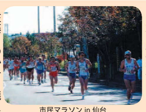
市民マラソン in 仙台

問 県地域防災計画改正を踏まえ、市災害ボランティアセンターの設置場所の明示を、中心となって設置・運営を行う市社会福祉協議会と場所を協議中だが、仙台市福祉プラザを念頭に検討しており、今年度内に決定したい。その他の主な質問項目 市総合防災訓練のあり方と地域防災訓練への関わり方 気管挿管実施体制の充実を市民利用施設予約システムの検証と改善を 情報セキュリティの強化を屋外広告物条例の実効ある改正を 犯罪の未然防止や市民マラソン in 仙台に関して県警との協力体制強化を