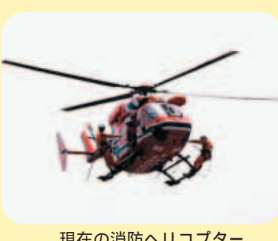
現在の消防ヘリコプター

問 消防ヘリの二機目導入の目的は、市内の救急、防災と他都市との相互応援の二つに大きく分かれると思うが、導入検討委員会の答申も踏まえ、どちらを重視するのか。 答 現在のヘリコプターは市内での災害や救急救助活動等に使用しているが、法体系が整備され、緊急消防援助隊という全国的組織の中で本市は、北海道地区及び新潟