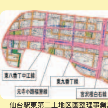
仙台駅東第二土地区画整理事業計画図

問 西公園プール等の運営管理を公募による指定管理者に行わせることについて、人命にかかわるような事故の責任の所在はどうか。 答 施設そのものや市の指示等に起因する事故は市の責任となり、施設の維持管理、運営管理によるものは指定管理者の責任と考える。 問 日影規制を強化した場合には不適格となる建物の数は、分譲マンションの約八