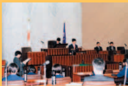
本会議場での審議を体験する吉成中学校の生徒たち

1月28日に第2回子ども議会(議会体験プログラム)を開催しました。このプログラムは、仙台市議会で実際に成立した議案等を題材に作成したシナリオに基づいて、子どもたちが実際に議員になったつもりで委員会・本会議の審議を体験するものです。小学5年生から中学生の参加団体(10人 60人程度)を募集しています。申し込みは随時受け付けます。