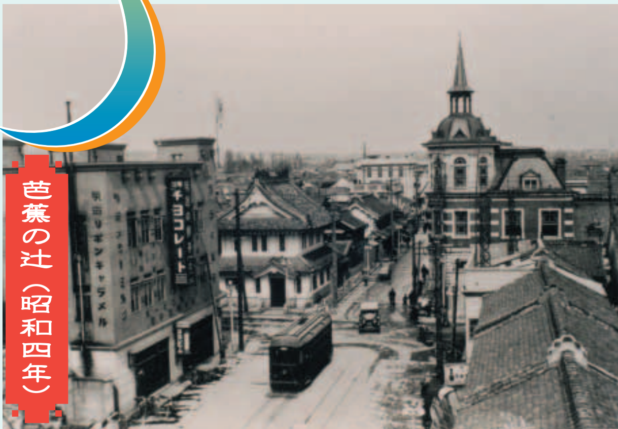
芭蕉の辻(昭和四年)

↑ 南(青葉通側)から北を望む 藩政時代に造営された城櫓風の建物(安田銀行)と、明治36年に建てられたレンガづくりのドイツルネッサンス式の洋風建物(元七十七銀行本店)が、芭蕉の辻の北側の西と東に位置して対照的で、名所となった。 市電は芭蕉の辻を昭和3年から19年まで走っていた。