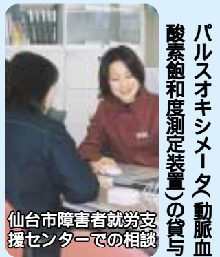
仙台市障害者就労支援センターでの相談

会計・款別主な質疑項目 補正予算 初心者向けの情報通信技術講習の実施方法について 保留地販売価格の下落による区画整理事業の諸問題 公営企業に対する児童手当負担金の支出について 総務費 職員研修所を部に昇格させ研修体制を拡充すべき